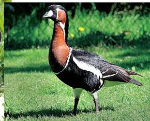
Bernache à cou roux