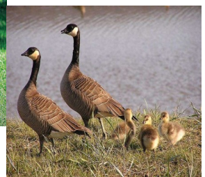
Bernache de hutchins